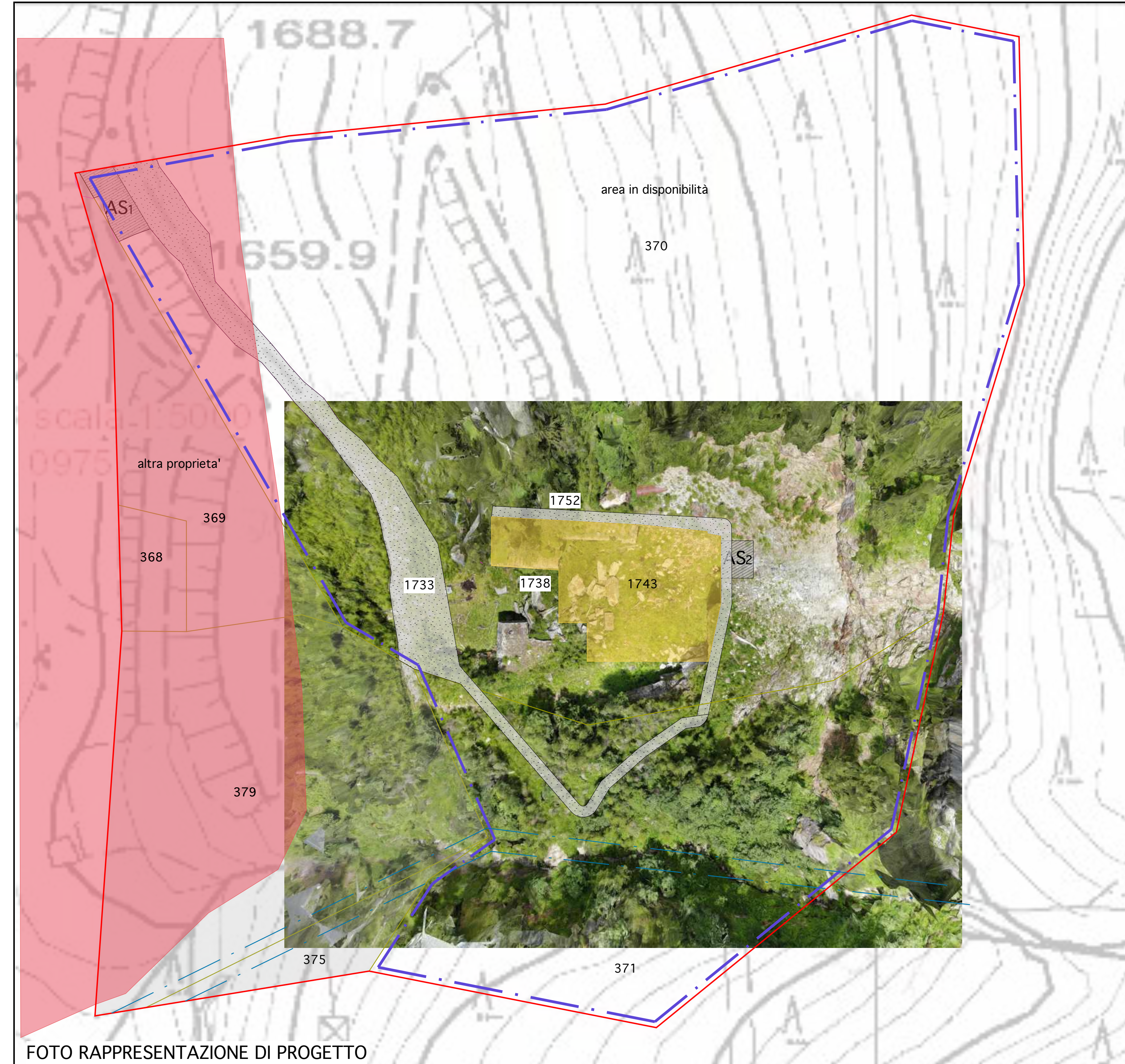
FOTO RAPPRESENTAZIONE DI PROGETTO